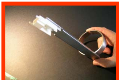
IRVFFHFE Outillage nettoyage VF 45 femelle