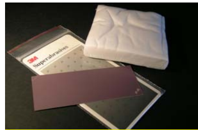
VOL 0562K Film abrasif 1 µm diamant (5 unités)