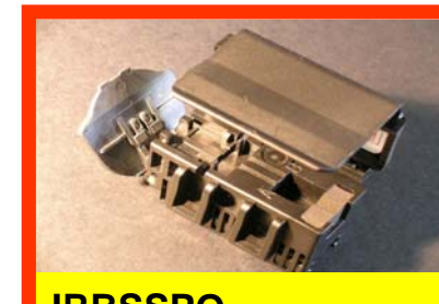
IRBSSPO Bloc de sertissage Surface polishing ouvert