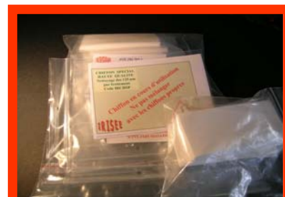
IRCHSP Chiffons spéciaux haute qualité