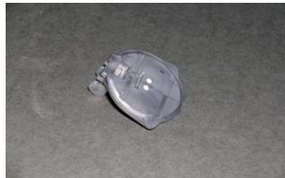
VOL 0560G Surface pour bloc de polissage