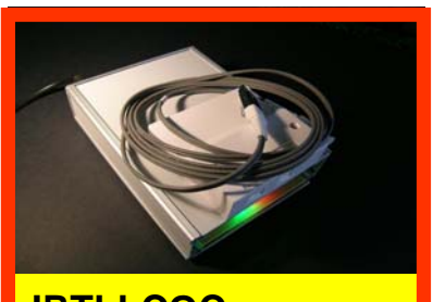
IRTLLCOC Testeur lumineux à LED de continuité et de croisement