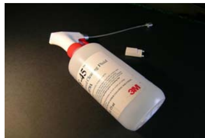
VOL 0570 Kit de nettoyage VF45 femelle pour HFE