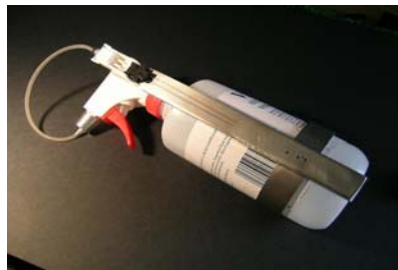
Flacon non inclus Nettoyage VF 45 femelle Monté sur flacon HFE