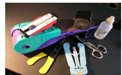
VOL 0563 Kit de mise en œuvre de VF45 multi et monomode avec microscope 100x