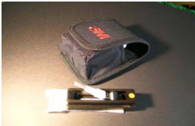
VOL 0570B Kit de nettoyage des fiches VF45 Mâle (plug)