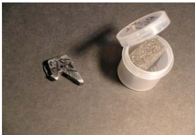
VOL 0562J Lame de clivage